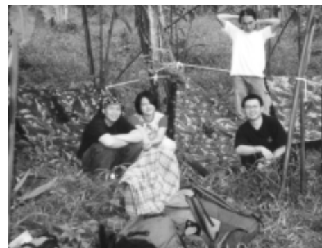
Peserta PD Bimover

Panitia sengaja mengundang instruktur berpengalaman, serta anggota tetap senior Bimover. Selain ketrampilan-ketrampilan