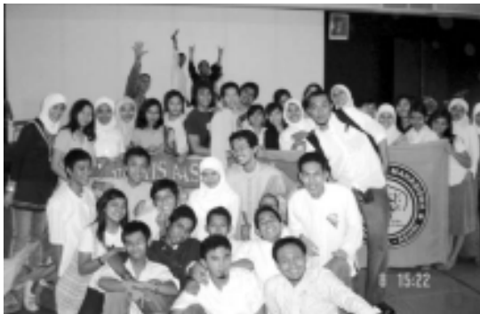
Panitia Halal Bihalal ■ Dok Rohis IBII

Unit Kegiatan Mahasiswa (UKM) Rohis mengadakan acara halal-bihalal pada hari kamis tanggal 8 Desember 2005 yang bertempat di ruang Auditorium Lt.3 kampus IBII, dengan mengusung tema “Bersatu Kembali Fitrah”. Acara yang dikemas dalam bentuk Tausiyah dan hiburan ini menghadirkan Da'i kondang Ustadz Ade Purnama (Narasumber RAS FM), dalam ceramahnya beliau menjelaskan bahwasannya puasa merupakan moment penting dan nikmat yang diberikan oleh Allah SWT kepada manusia sebagai sarana pembelajaran untuk mengendalikan hawa nafsu, serta makna fitrah yang sesungguhnya adalah kembali kepada nilai-nilai Islam, bila nilai-nilai Islam tersebut telah