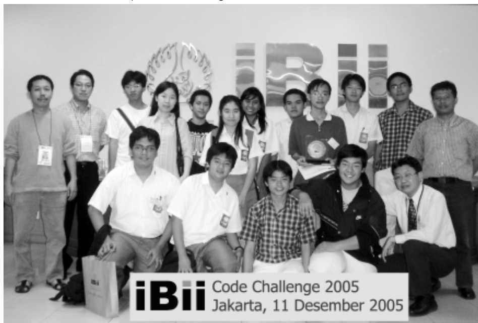
Para peserta IT Challenges 2005, berfoto dengan paniti pelaksana