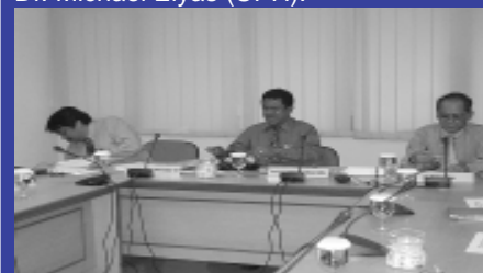
Pembicara Visitasi BAN